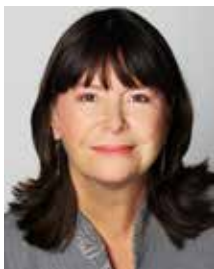
Ulrike Höfken Ministerin für Umwelt, Landwirtschaft, Ernährung, Weinbau und Forsten Rheinland-Pfalz